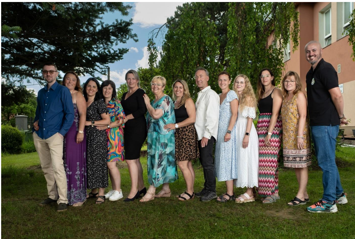
Fotografie z focení tříd na konci školního roku.