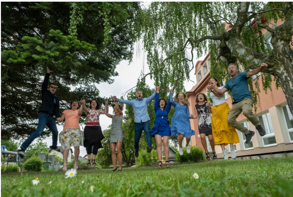
Fotografie z focení tříd na konci školního roku.