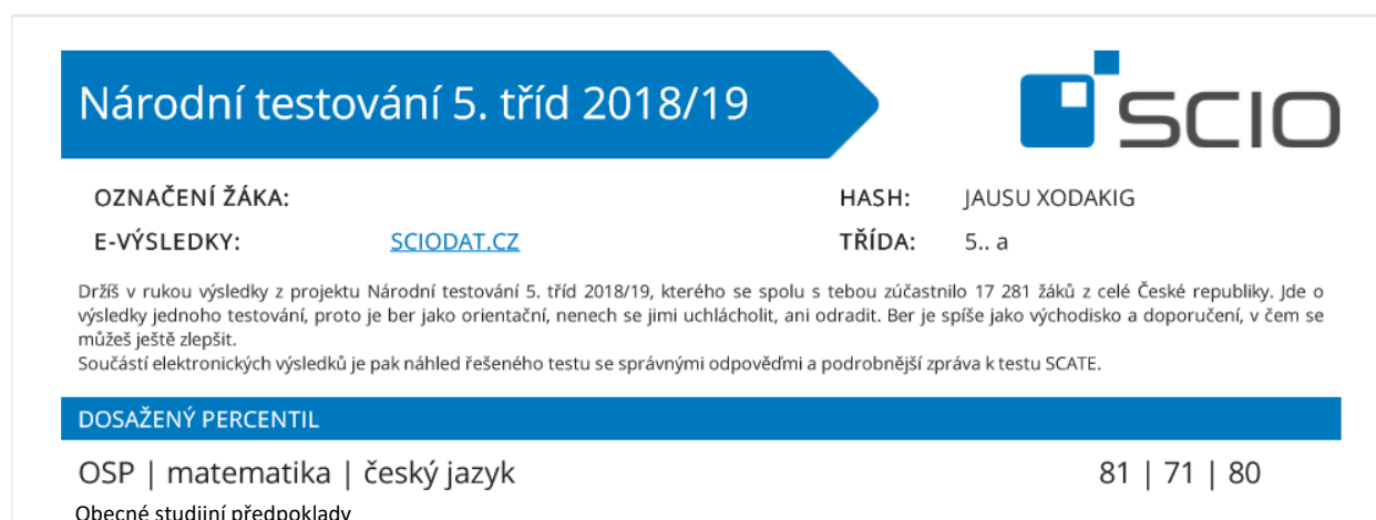
Obrázek 2. Výsledky žáka 5. ročníku