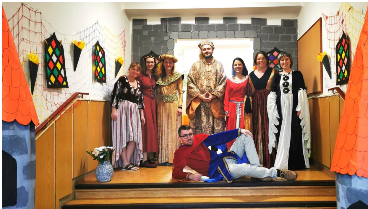
Fotografie ze zápisu do 1. ročníku.